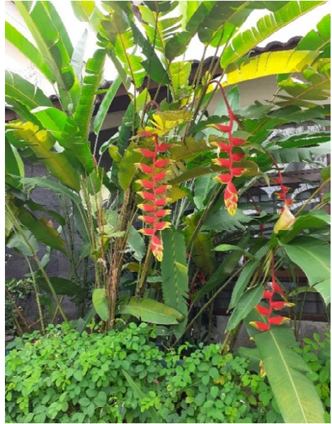
(Text & Foto)