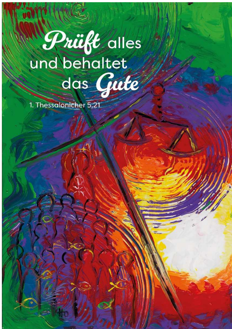
Acrylmalerei von Doris Hopf